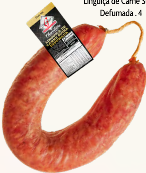
Linguiça de Carne Suína Defumada . 4