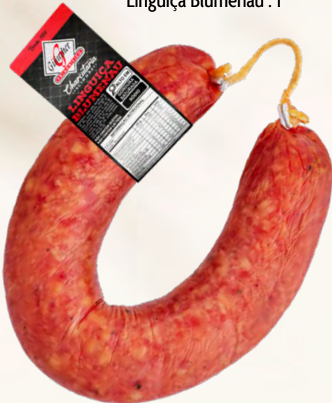
Linguiça Blumenau . 1