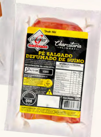
Pé Defumado . 62