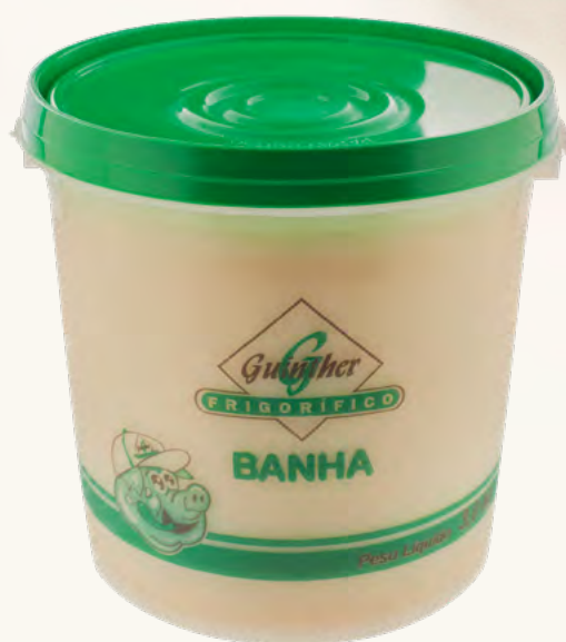
Banha Balde. 3KG