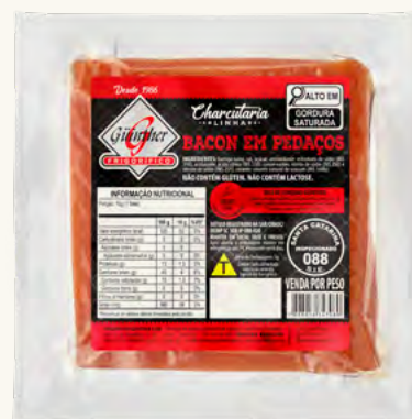
Bacon em Pedacos . 13