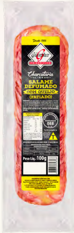
Salame Fatiado com Queijo 100G . 421