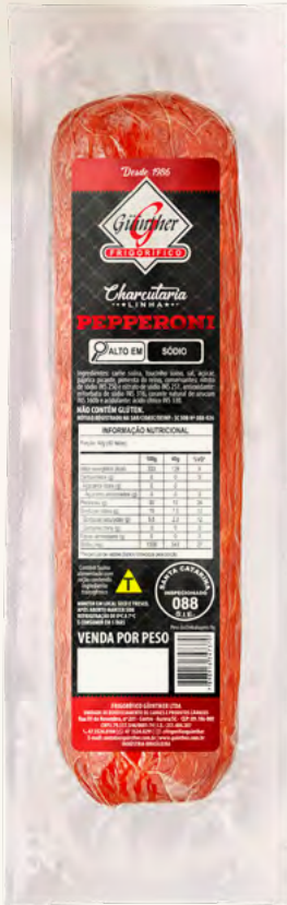
Pepperoni . 145