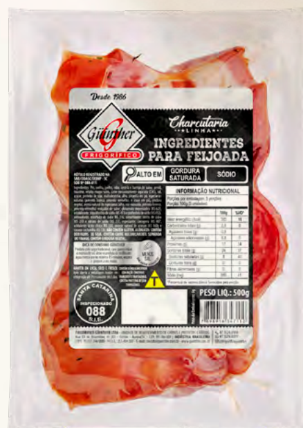
Ingredientes para Feijoada . 202