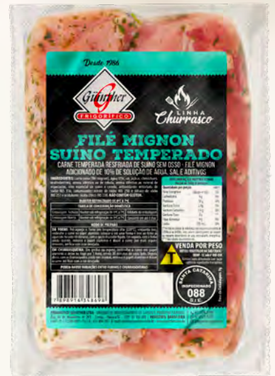
Mignon. 300G à 600G