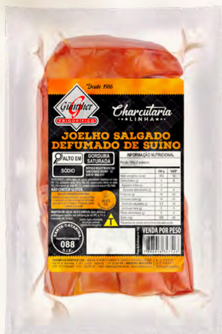
Joelho Defumado . 202