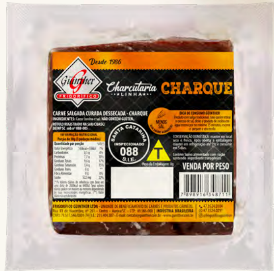
Charque em Pedacos. 250G à 400G