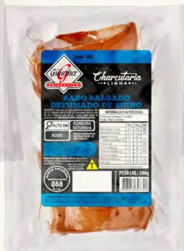
Rabo Defumado . 21