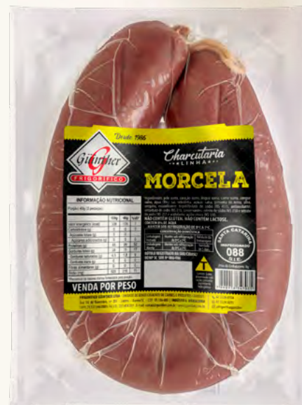
Morcela. 200G à 450G