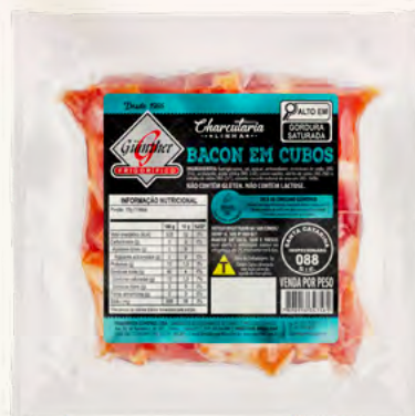
Bacon em Cubos . 140