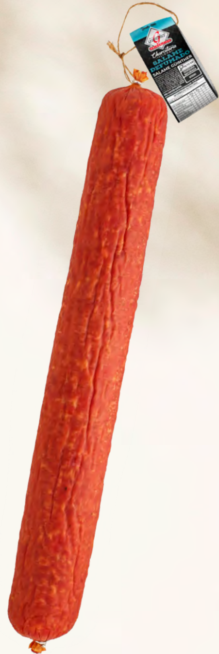
Salame "Güinther" . 10