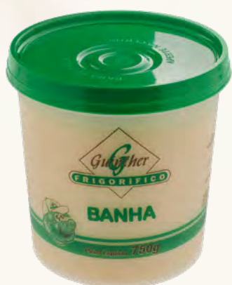
Banha Balde. 750G