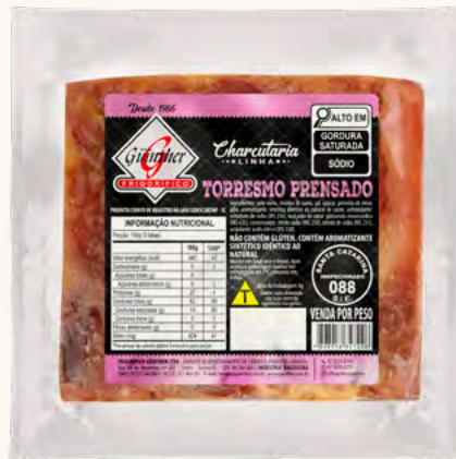
Torresmo Prensado Cozido . 49