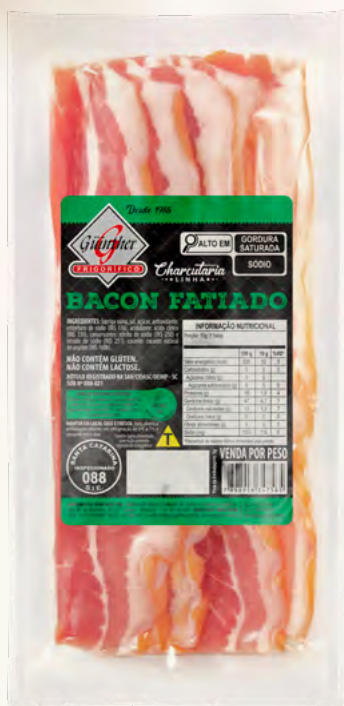
Bacon Fatiado . 950