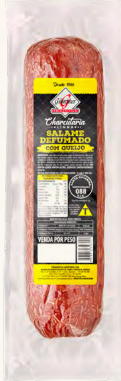
Salame Defumado com Queijo . 56