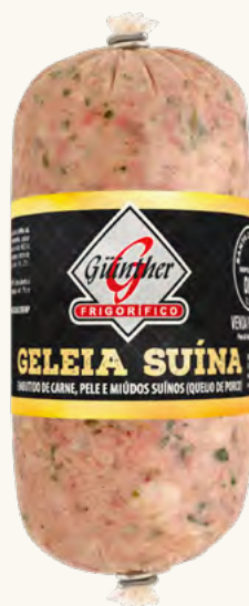
Geleia de Porco. 300G à 600G