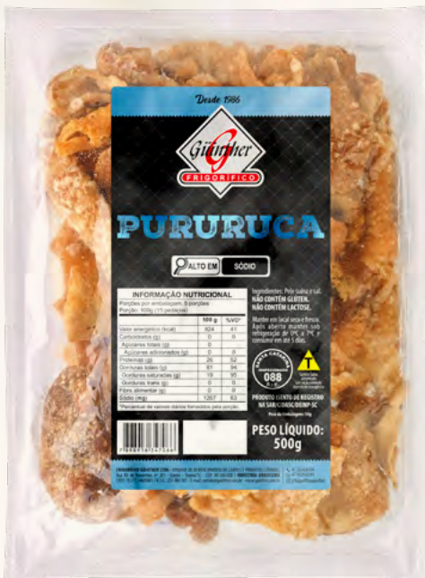
Torresmo Pururuca "Cascão" . 18