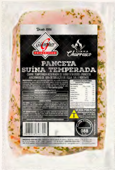
Panceta. 300G à 600G