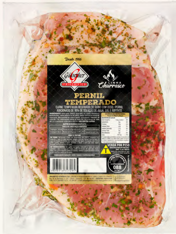
Pernil. 500G à 1.2KG