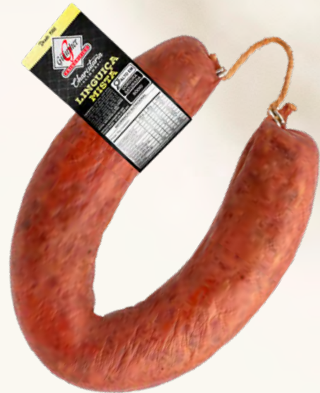
Linguiça Mista . 4