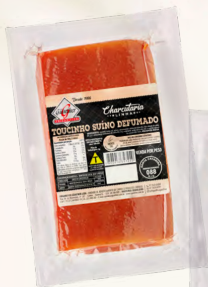
Toucinho Defumado . 15