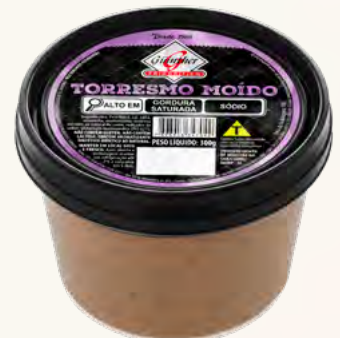
Pote de Torresmo Moído . 36