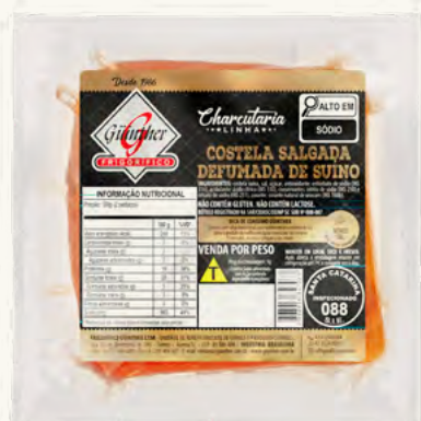
Costela Defumada . 14