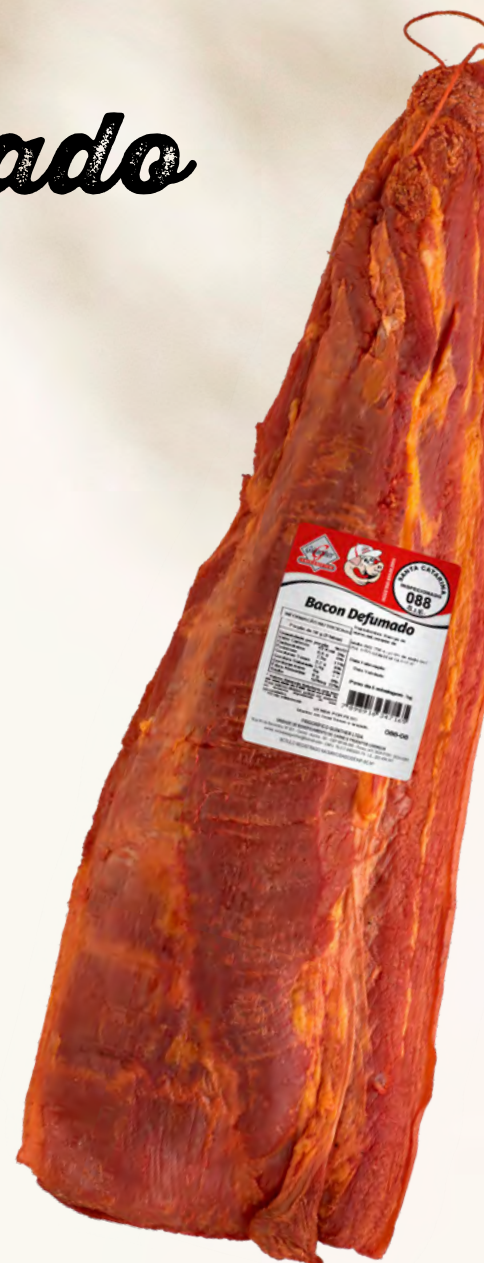
Bacon em Manta. 12