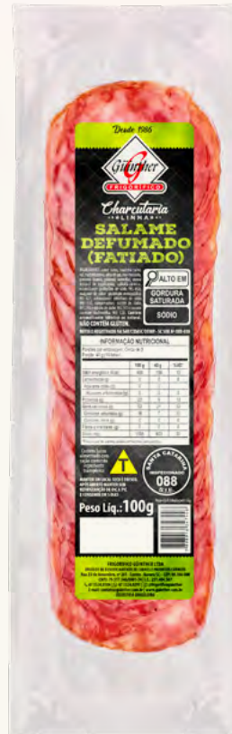
Salame Fatiado . 166