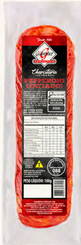
Pepperoni Fatiado . 165