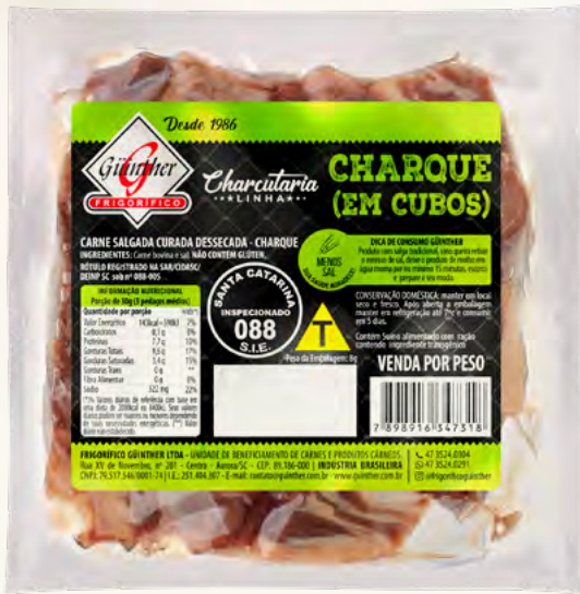
Charque em Cubos. 250G à 400G