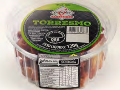
Torresmo em Pote . 351