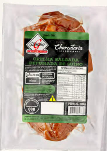
Orelha Defumada . 24