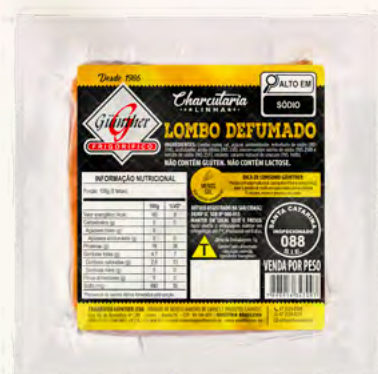
Lombo Defumado . 17