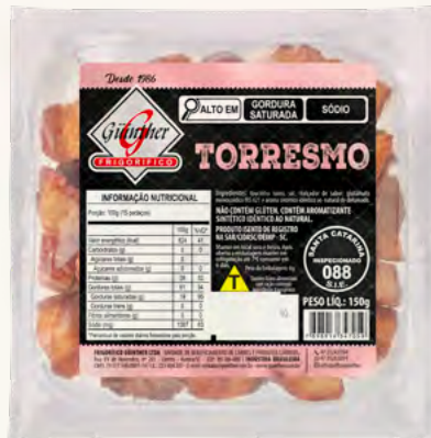
Torresmo "Quadrado" . 35