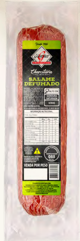
Salame Defumado . 9