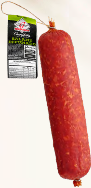
Salame Defumado "solto" . 8