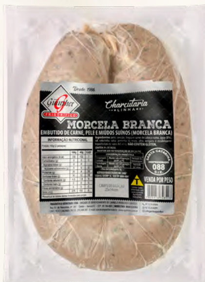
Morcela Branca. 200G à 450G